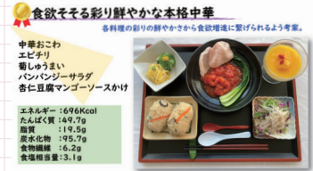
クックサーブ部分でグランプリを獲った「食欲そそる彩り鮮やかな本格中華」