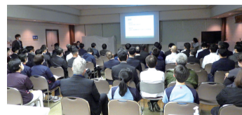
複数の消防本部から救急隊員など多くの職員が参加

湘南大磯病院(神奈川県)は12月2日、院内で第3回救急医療セミナーを開催した。大磯町、二宮町、平塚市、小田原市、秦野市の各消防本部から救急隊